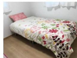
4. 子供部屋 シングルベッド