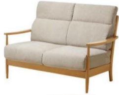
2. リビング ソファ