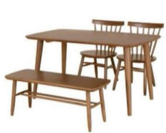
1. 食卓テーブルセット (テーブル・椅子)