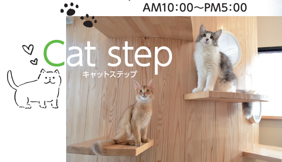
※写真はイメージです 建物面積 / 117.16㎡ (35.44坪)